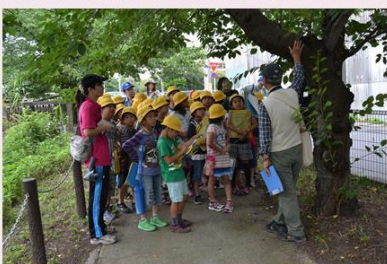
最初に発見したのは稲荷小の子供たち

葛西用水の青柳堰上流が一番目でした。2 例目3例目は幼虫の食べかすフラスが見つかりこの年伐採してもらいました。最初に見つけられたカミキリは、中国などを原産としているクビアカツヤカミキリと同定され、中国をはじめとしてバラ科の樹木に多大な被害を当てている厄介な昆虫だと判明。私共協会では風評を恐れて公表すべきか否かを検討した結果、この虫が自然生態系に入ったら大変なことになるということでプレスリリースをしました。イギリスの BBC テレビでも花見がピンチと紹介されました。世界では自然分布の中国、朝鮮半島、東南アジア、イタリア、ドイツ、イギリス、アメリカなどで報告されています。日本では、愛知、埼玉、徳島、群馬、東京、大阪などに分布