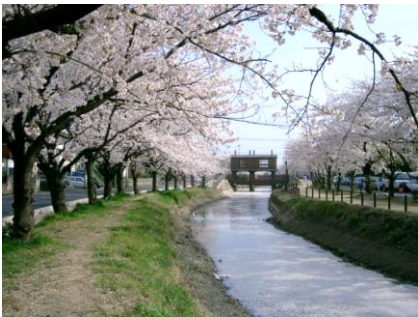
10年前のサクラ並木