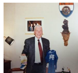
New York Rotary Club 例会