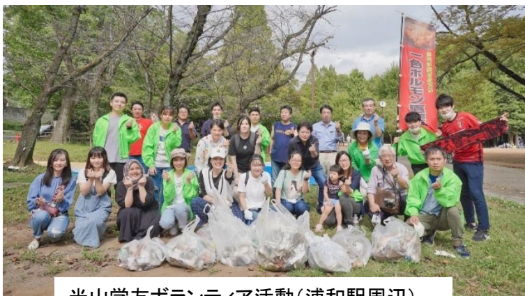
米山学友ボランティア活動(浦和駅周辺)

今日八潮 RC でも同じことをしましたが、数倍よかったです。彼女はお手伝いをしてくれたりと、彼女がいると明るくなり、感謝しています。今日はありがとうございました。宜しくお願い致します。