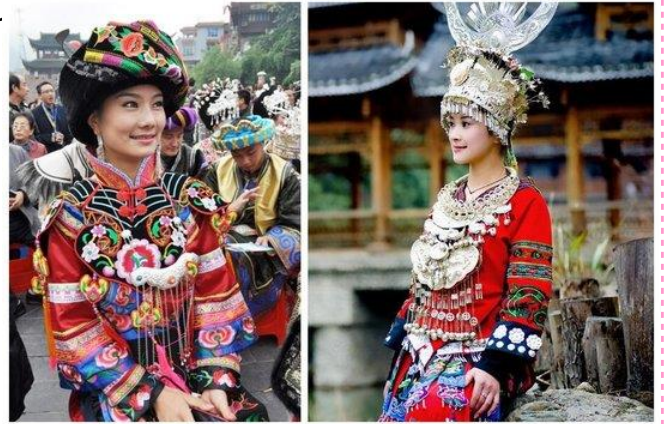
恩施土家(トゥチャ)族と苗(ミャオ)族の民族衣装