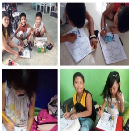
主題的プログラム