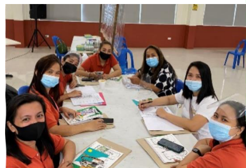
教師の育成とパートナーシップ