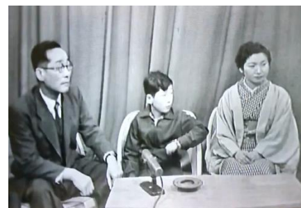
このような歴史があります。