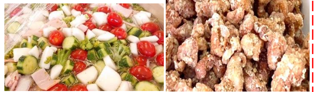
お野菜いっぱい唐揚げ弁当

いただいて唐揚げ粉つけて揚げてみました。最近ちょっと人手が足りなくていつも来てくれる方が手伝ったりしてくれて、凄くありがたいのです。